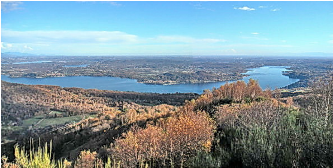
Il Lago Maggiore dall'Alto Vergante