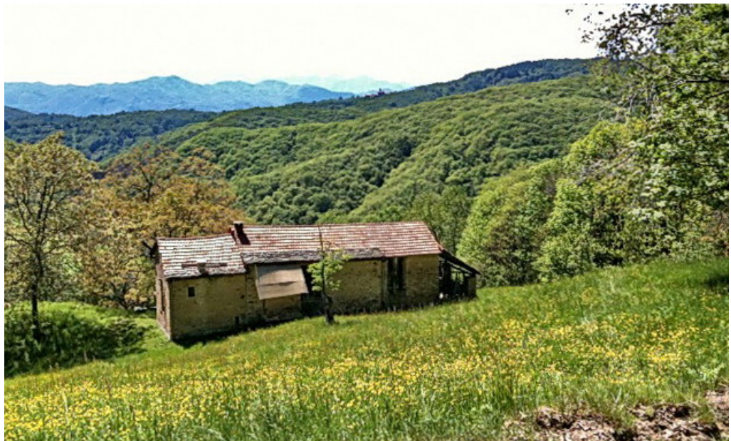
Cascine tra i boschi dell'Alto Vergante